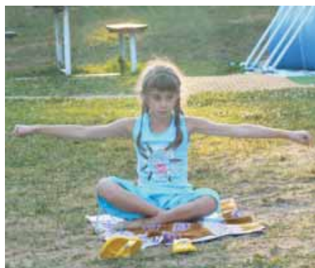
Každý den začíná rozcvičkou.

Programovou součinnost nám poskytly i obecní úřady, některé podniky, občanská sdružení. Krajský úřad Pardubického kraje a několik obecních (městských) úřadů, které uvádíme v čísle, uvolnily účelově vázané prostředky k obohacení doprovodného kulturního a rekreačně sportovního programu.